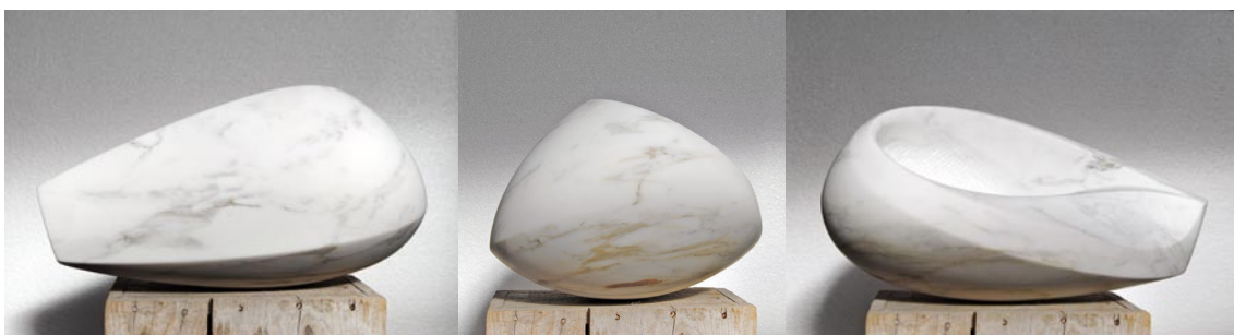
Mumtaz Mahal 2012 Carrara-Marmor 30 x 41 x 61 cm 4.600 €