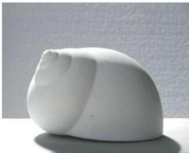
Helix 2011 Carrara-Marmor 15 x 18 x 25 cm 1.600 €