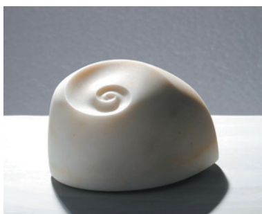
Simsala II 2011 Carrara-Marmor 10 x 12 x 15 cm 500 €

Meine nächsten AUSSTELLUNGEN: - Kunstsalon Fliegel/Weisheit Wielandstr. 33, 10629 BERLIN SA 11. + SO 12. Feb. 2012 16 - 20 Uhr - AIV BERLIN, Bleibtreustr. 33, 10707 BERLIN 04. Mai bis 10. Aug. 2012 Vernissage: FR 04. Mai, 18 Uhr - HofArt Wachtberg bei BONN Holzemer Str.4, 53343 WACHTBERG Eröffnung: FR 11. Mai 2012 19 Uhr, 12. 05. 14 -19 Uhr, 13. 05. 11-18 Uhr