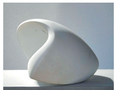
Wiegenschritt 2011 Carrara-Marmor 27 X 24 x 37 cm 3.800 €