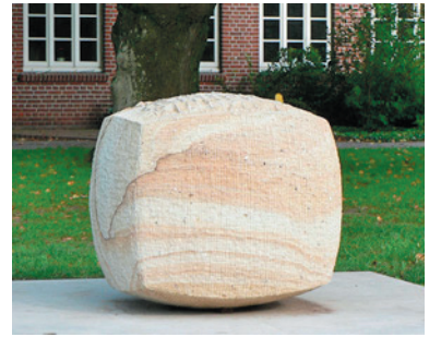
Symposium 'Der Lauf der Dinge'

Diese Skulptur entstand im Juni 2011 während des III. Bildhauersymposiums in Lindern (Oldb.). rechts: Entgeltiger Aufstellungs-ort in der Gemeinde Liener (bei Lindern) vor der alten Dorfschule. unten: Arbeitsfoto während des Symposiums.